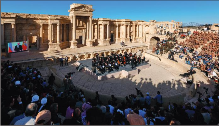
Освобожденная Пальмира. На концерте симфонического оркестра петербургского Мариинского театра под руководством народного артиста России Валерия Гергиева в Римском амфитеатре сирийской Пальмиры, освобожденной от террористов ИГИЛ.