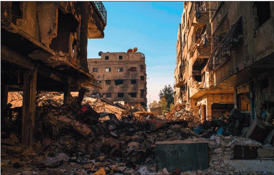
Разрушенный боевиками ИГИЛ Дамаск.

Террористы поставили на поток производство видеороликов с жестокими сценами казней пленников, заложников и «вероотступников». Эти материалы потом широко распространяются в социальных сетях и