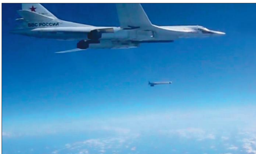
Воздушная операция российских ВКС по уничтожению боевиков ИГИЛ в Сирии.