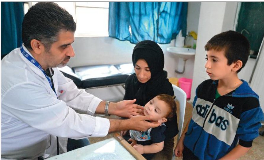
Истинный ислам призывает к состраданию и милосердию. Врач осматривает ребенка в медицинском пункте лагеря при одной из школ Дамаска.

Радикалы объявляют «врагами ислама» всех несогласных с ними мусульман. Ультрарадикальные группировки признают террор и насилие единственным способом достижения провозглашенных ими целей.