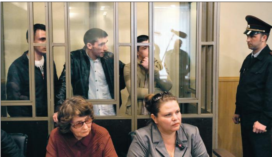
В Российской Федерации предусмотрена административная и уголовная ответственность за пропаганду идей терроризма, участие в деятельности террористических организаций.