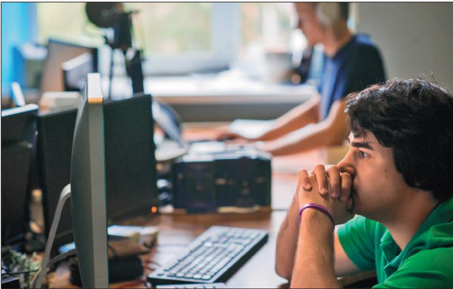
Постоянное присутствие вербовщиков ИГИЛ в соцсетях.

Активисты ИГИЛ поддерживают свои аккаунты в сетях Facebook, Twitter, Instagram, Friendica, Telegram. Активно они заявили о себе и в российских социальных сетях: «ВКонтакте» и «Одноклассниках».