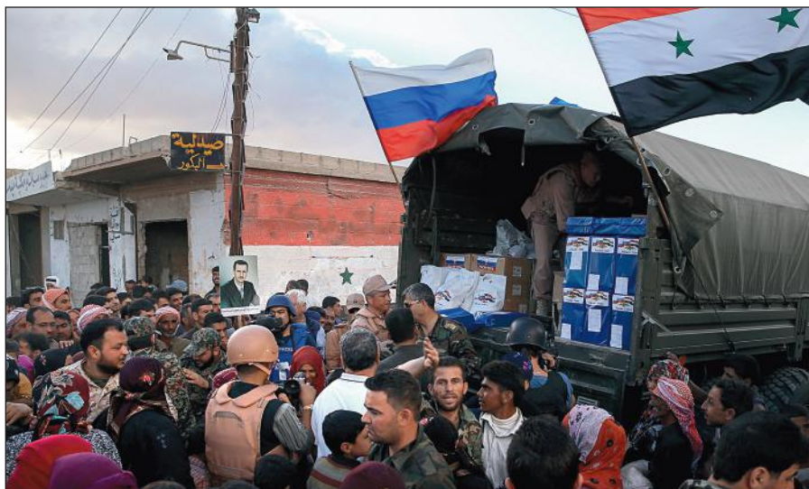
Россия оказывает гуманитарную помощь Сирии.