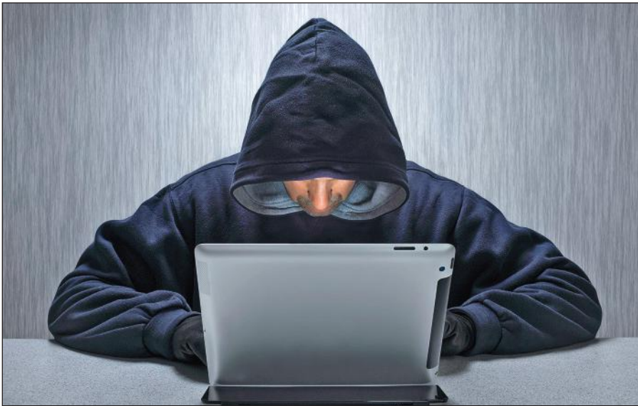
Вербовщики ИГИЛ активно используют Интернет.

Террористы день ото дня совершенствуют методы вербовки новых сторонников, а также алгоритмы их идеологической обработки. Читателю стоит помнить, что те типовые ситуации, которые описаны в данном пособии, можно рассматривать лишь в качестве базовых ориентиров,