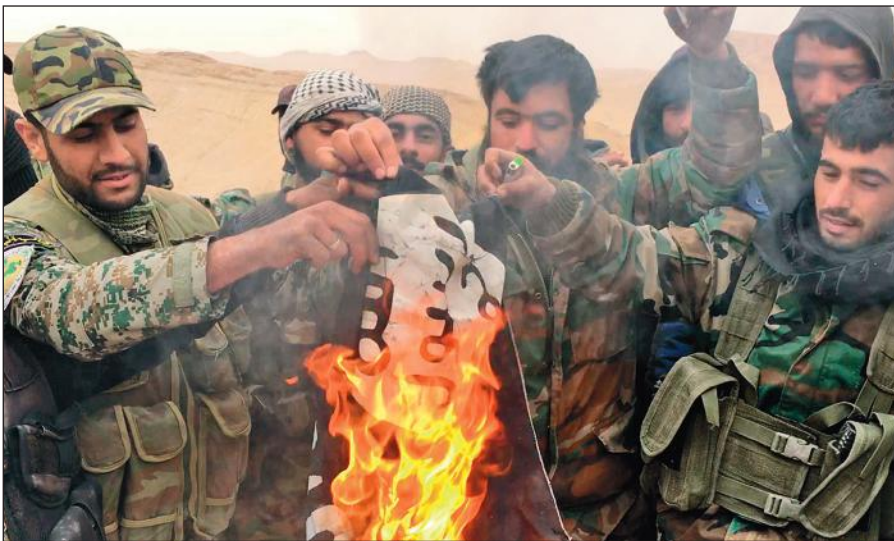
Народные ополченцы САР сжигают флаг ИГИЛ, снятый с отбитой у боевиков цитадели Пальмира.

Современное государство обязано защищать интересы каждого своего гражданина вне зависимости от его расы, национальности, принадлежности к определенной конфессии или религиозной традиции, в то время как ИГИЛ выражает интересы небольшой группы религиозных радикалов, жестоко подавляя остальную часть населения посредством запугивания, насилия и террора.